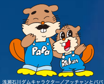
浅瀬石川ダムキャラクター/アッチャンとババ