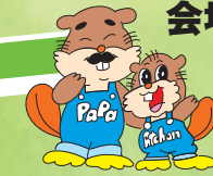
浅瀬石川ダムキャラクターノアッチャンとババ