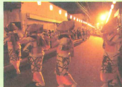
日本三大流し踊りの「黒石よされ」