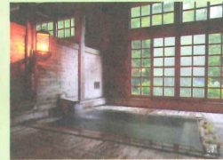
県内有数の湯処「黒石温泉郷」