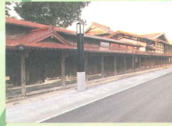
江戸情緒が今も残る「中町こみせ通り」

黒石市は夏は黒石よされや黒石ねぶた、秋は紅葉など、歴史深い町並みや温泉、豊かな自然に囲まれたまちです。またご当地グルメ「黒石つゆやきそば」も有名です。見ても楽しい、食べても美味しい。そんな黒石市を巡る旅をお楽しみください!!