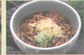
黒石のソウルフード「黒石つゆやきそば」