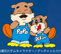
浅瀬石川ダムキャラクター／アッチャンとババ