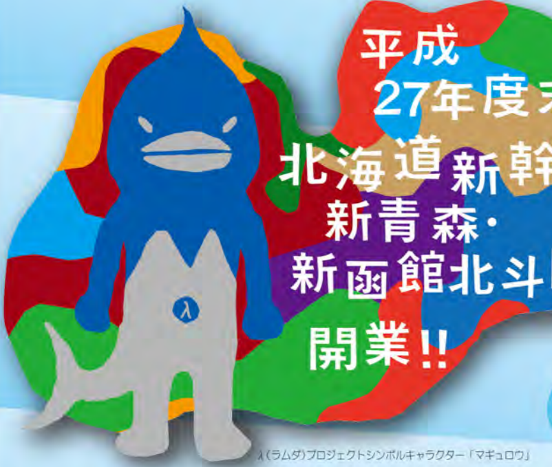
ラムのプロジェクトシンボルキャラクター「マキウロウ」